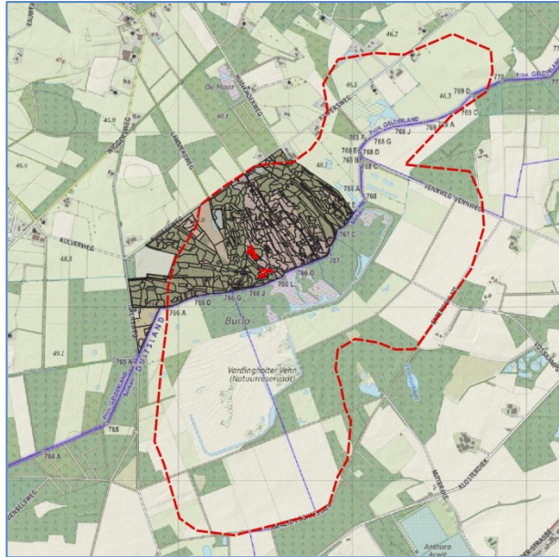
Figuur 1 Hoogveenlandschap (naar onderzoek Jansen et al., 2013)

Het lokale type 08-17 type van fraai veenmos van rompgemeenschap van riet en haakveenmos, bestaat uit veenmos met riet. De opname noemt hierbij een hoge bedekking van fraai veenmos, samen met pijpenstrootje en gewimperd veenmos. Vlakken behorend tot het lokale type 08-17 zijn bij de aanwezigheid van >25% veenmos en pijpenstrootje (presentie) gerekend tot 10RG04, rompgemeenschap van pijpenstrootje. Deze vlakken kwalificeren daarmee als habitattype H7120. Wanneer de toevoegingen in het vlak alleen riet aangeven, is het vlak toegedeeld tot de rompgemeenschap van riet en waterveenmos (r8RG18), die niet kwalificeert als habitattype H7120.