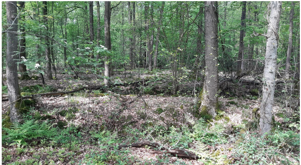
Figuur 1 Rabattenbos in Leusveld

Als ondergrond voor de T0-kaart uit 2014 is de top10-vector gebruikt. Deze wijkt soms iets af van de luchtfoto, bijvoorbeeld wat betreft de locatie en breedte van paden. Dit gaat om kleine verschillen en dit is niet gecorrigeerd.