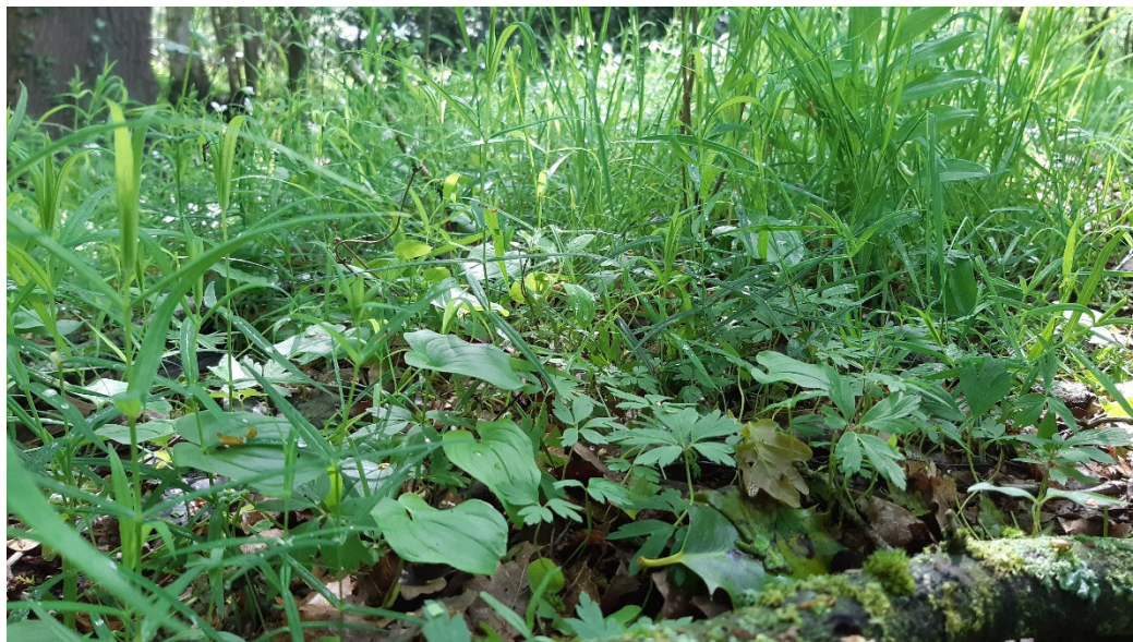
Figuur 2 Dalkruid, grote muur en bosanemoon

Niet of weinig veranderd. Op een deel van de oppervlakte waar het habitattypen in 2019 (T1) aanwezig is, is aanwezigheid in 2013 (T0) niet zeker door onvoldoende basisgegevens. Deze delen staan als zoekgebied (ZGH9160A) op de herziene T0-kaart.